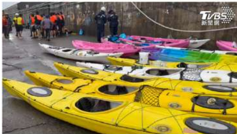
今天天氣不佳造成獨木舟翻覆幾名學生落海，全員均平安上岸。

基隆海洋大學的31名師生今(24)日上午8時左右，在八斗子漁港外海練習獨木舟，因風浪較大，又受海流阻礙導致獨木舟翻覆，